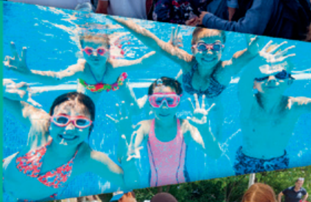
MALWETTBEWERB MUSIK ERLEBEN SCHWIMMKURSE