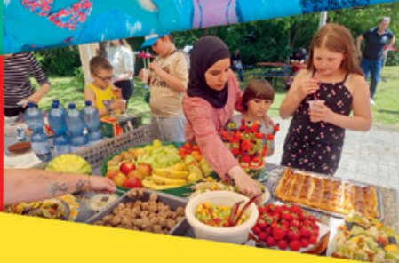
SENIORENKINO TAFEL WÜNSCHEBAUM