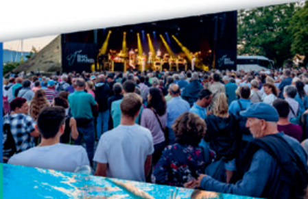
BIGBAND KONZERT EISLABOR FRAUENHAUS